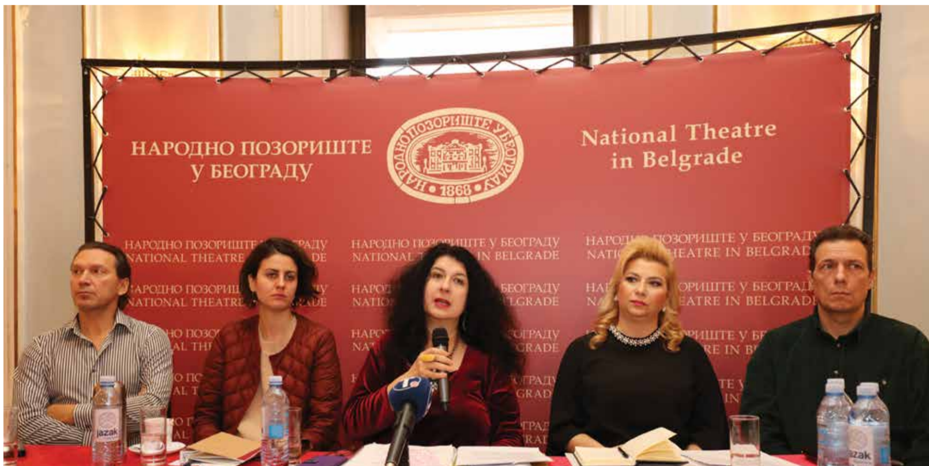
ОДРЖАНА ТРАДИЦИОНАЛНА НОВОГОДИШЊА КОНФЕРЕНЦИЈА ЗА НОВИНАРЕ