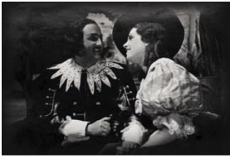
Лучија од Ламермура из 1940.

жњачке и „тмурне и језовитошћу прожете нордијске средине либрета“, између осталог захваљујући и „укусном и стилски рафинираном“ декору и костимима. И овог пута, солисти су освојили симпатије критике, а