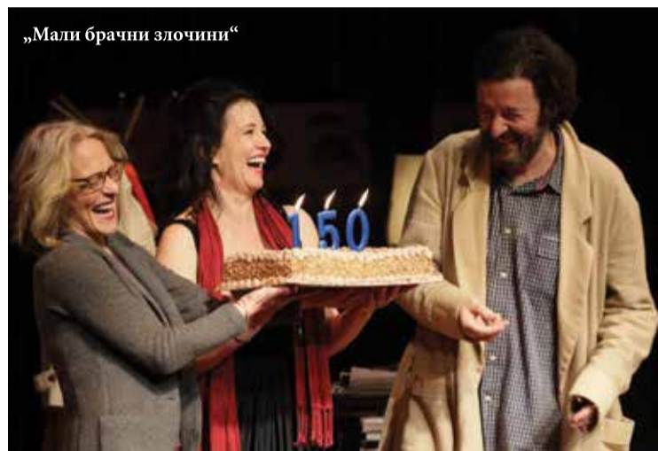
„Мали брачни злочини“

После неколико бисева, на сцени се појавила в.д. директорке Дrame Народног позоришта