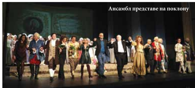
Ансамбл представе на поклону