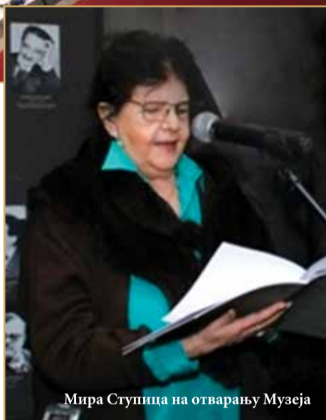
Мира Ступица на отварању Музеја

Р ечима: Имам част да као најстарији члан ове славне и сјајне позоришне куће у Србији објавим - дана, 22. новембра, Музеј Народног позоришта у Београду је отворен, најбоља српска глумица прошлог века Мира Ступица отворила је пре једну деценију, 2010. године, ту институцију, која се налази у реконструисаном простору, у сутерену зграде, у којем је годинама био ресторан „Боеми“.