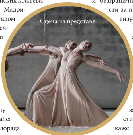
Сцена из представе