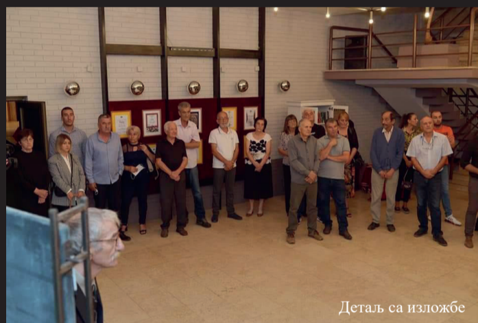
Детаљ са изложбе