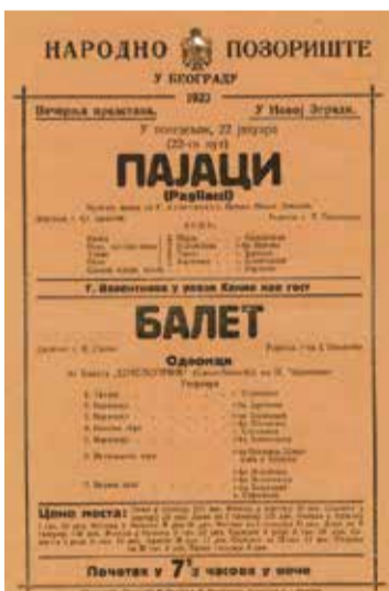
Одломци из „Крцка Орашчића“ одиграни су после извођења Леонкавалове опере „Пајаци“: Заједнички плакат за обе представе, изведене 22. јануара 1923. године

Од 1923. године, на сцени Народног позоришта у Београду, догодило се више премијерних извођења балета „Крцко Орашчић“, у редакцији различитих кореографкиња и кореографа који су упризоравали чувену Хофманову причу. Истина, та бајка (која је послужила за либрето) није била омиљена, па чак ни по укусу њеног композитора, П.И.Чајковског. Ипак, то га уопште није омео у креацији трећег ремек дела балетске уметности (поред „Лабудовог језера“ и „Успаване лепоти-