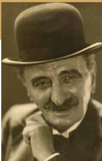
Нушић је на челу Народног позоришта у Београду био у периоду од 14. јула 1900. до 19. јануара 1902. године

Иако је и сам био политички активан, често је исмевао политичаре и оне на власти па је због тога чак