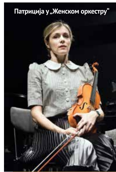
Патриција у „Женском оркестру”