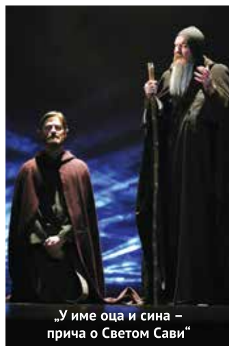
„У име оца и сина – прича о Светом Сави“

Представа „Сањао сам да сам се пробудио“ говори о животу у једном позоришту посредством четири жанра који се крећу од фарсичне структуре, преко мелодраме, историјског каламбура до водвиљске игре, заокружујући слику наше, и не само позоришне стварности.