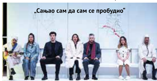
„Сањао сам да сам се пробудио“

биографске чињенице из живота Светог Саве од монашења до краја живота, прати његове бројне активности - како је организовао цркву, државу, увео законе, образовање, болнице, био дипломата, мирио зарађене... па све до смрти у Трнову.