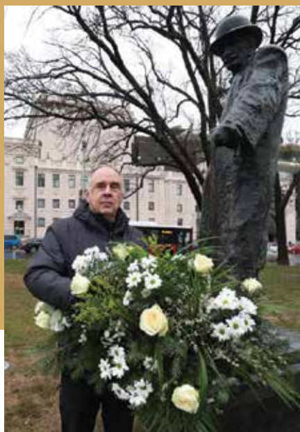
Управник Народног позоришта у Београду Светислав Гонцић положио је венац на споменик Браниславу Нушићу

ду, када је најавио да ће 2024. година бити посвећена једном од најплоднијих и најпопуларнијих српских писаца уопште.