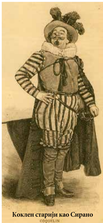
Коклен старији као Сирано

оцењује као „занимљиве“. Он истиче: „У Сирану добија Коклен прилике у сваком тренутку да покаже виртуозно изговарање