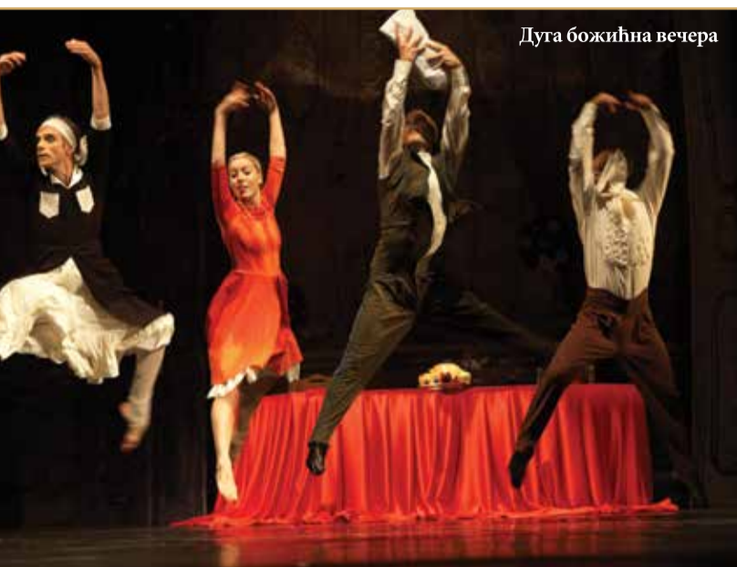
Дуга божићна вечера