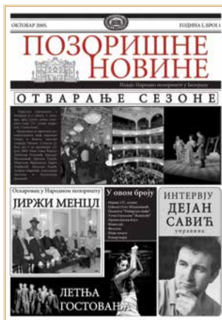
Први број Позоришних новина

Већ после трећег броја „Позоришне новине“ су, захваљујући чињеници да су, како је то приметио Јован Ђирилов, избегле замку синдикалног листа, почеле да излазе као подлистак